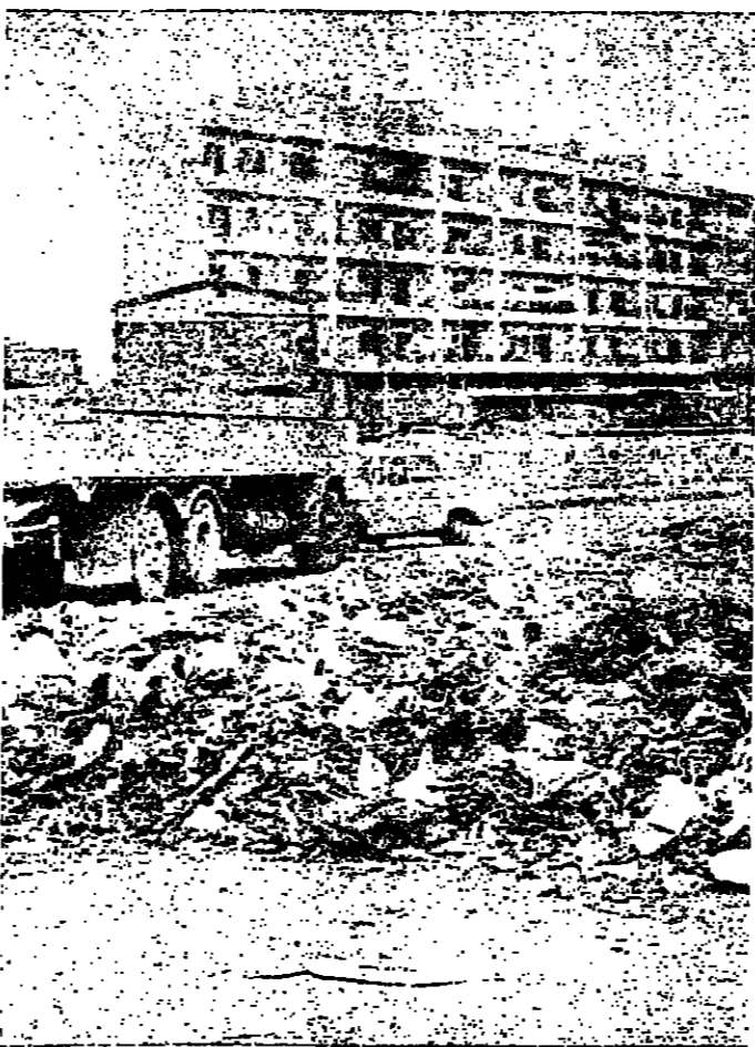
■ القمامة في كل مكان ■

طرابلس - « الانوار » : قضية هامة تشغل طرابلس : التنظافة . وشكوى هامة تصدر من كل حي من احياء المدينة ، جيليج بها المواطنين في الرقة ، كما في الشوارع الرئيسية : غياب عمال التنظيفات .. وتراكم القاذورات في الشوارع . وطرابلس الان مهدة بالارثمة اذا استمر القاء الاوساخ في الشوارع وعلى جوانب المنازل الامهلة بالسكان ، بعد تفكك ازمة البرفش والهوام . والان يأتي دور بلدية طرابلس . فهل تستطيع مصلحة التنظيفات ان نجح عناصرها ، ونحريهم في ورشة عمل سريعة ، لتنظيف المدينة من الاوساخ ، ونفرض مراقبة فعالة على المواطنين ، وخاصة في الاحياء الشعبية ، والمناطق ذات الكثافة السكنية ، كالتجاة وسوق الخضار وشوارع لطيفة ؟